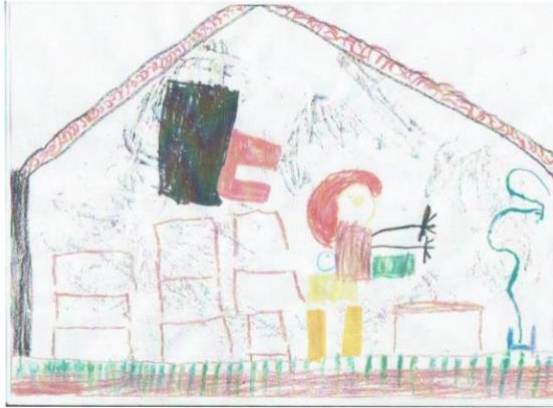
Zeichnung eines Kindes aus der Pilotstudie von seiner Schule

Die Datenauswertung beinhaltet eine qualitative Inhaltsanalyse der transkribierten Interviewtexte (vgl. ausführlicher Mayring 2010), in der Gemeinsamkeiten und Unterschiede einerseits zwischen den vier Pilotfällen, andererseits bei jedem Pilotfall zwischen den verschiedenen Interviewpartnern bzw. dem Zeitpunkt des Interviews (mindestens jeweils vor Beginn und nach Beendigung der Therapiesequenz) herausgearbeitet werden und so dann auch der Grundfrage nach den Auswirkungen der Eurythmietherapie nachgegangen werden kann.