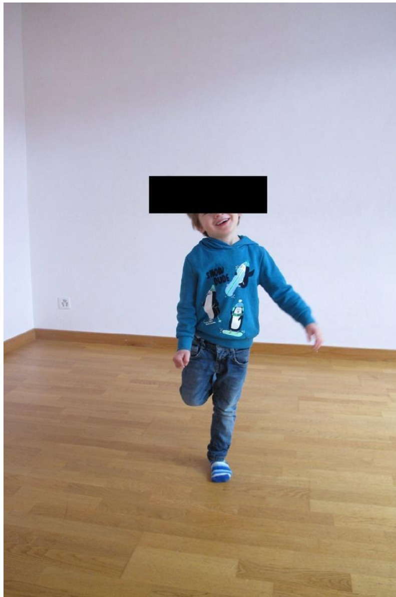
Bild eines Kindes aus der Pilotstudie, in dem in der Therapie erworbene Leichtigkeit sichtbar wird