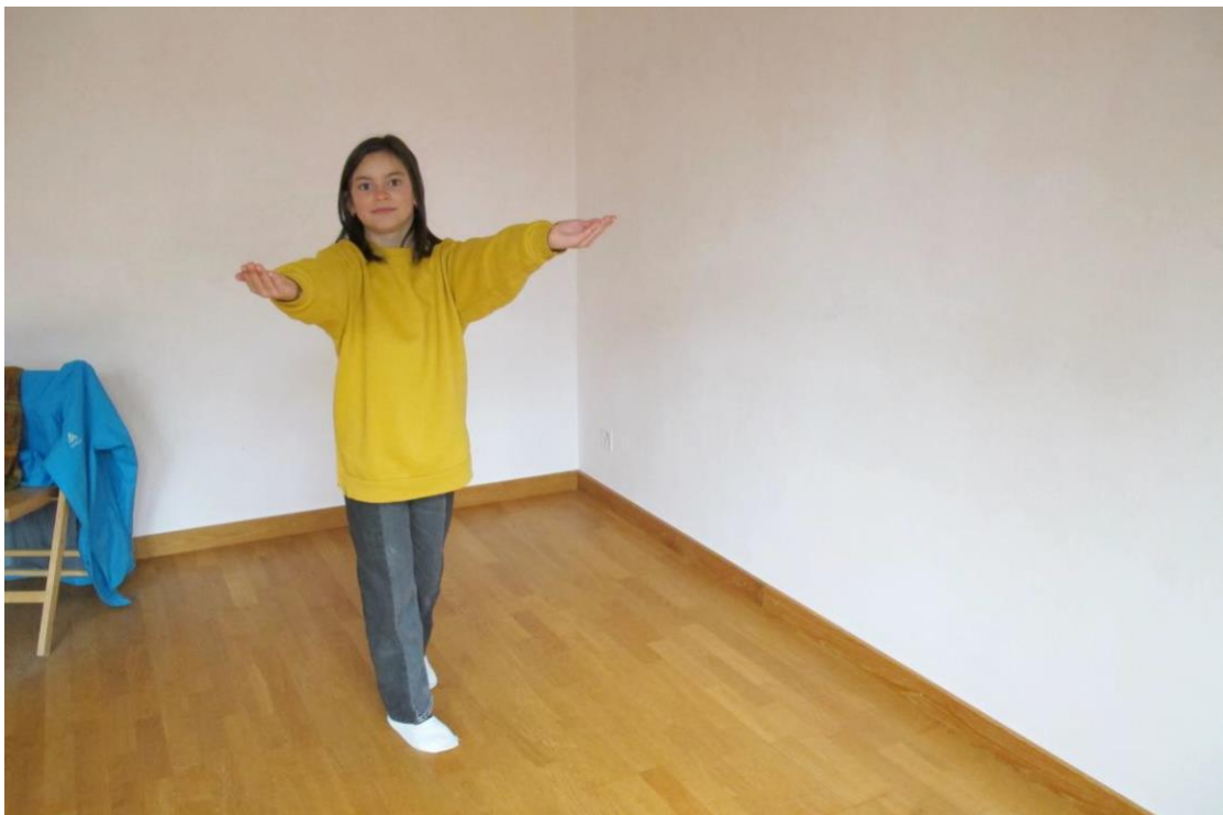
Mädchen mit oppositionellem Verhalten: Vorwärtsdrängender Wille wird durch die A-Gebärde zurückgehalten

Eine weitere Möglichkeit zur Typisierung der in der Pilotstudie untersuchten Fälle würde auf die Motivation der Kinder für die Heileurythmie fokussieren und wäre für eine vertiefende Analyse des Therapieverlauf interessant. Man würde dann zwischen einem Typus unterscheiden, bei dem die Kinder motiviert in die Therapie einsteigen und diese Motivation im Therapieverlauf auch erhalten bleibt (Fälle 2 & 4) und einem Typus, bei dem die Motivation gering ist und wo immer wieder auch motivationale Widerstände des Kindes überwunden werden müssen (Fälle 1, 3/5).